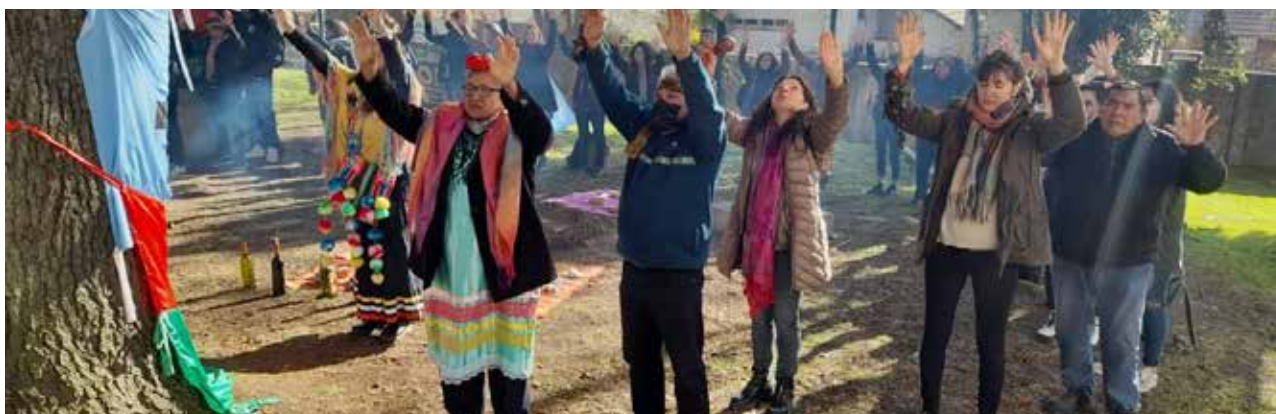
Acto Institucional – apertura

Así se dio inicio a las Jornadas "Territorialidades, interculturalidad y construcción de comunidad. Por la Madre Tierra que nos da la vida", que se realizaron en la Universidad Nacional de Quilmes entre el 29 y el 31 de Agosto de 2022.