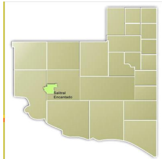
Figura 1. Ubicación propuesta del Área Protegida Salitral Encantado

El Gran Salitral ocupa una extensa depresión endorreica con una superficie de aproximadamente 60.000 hectáreas. Su volumen de agua es más o menos estable y se alimenta de lluvias ocasionales y por dos arroyos temporarios: el Potrol, que nace en la laguna El Juncal que, a su vez, recibe los aportes del arroyo de la Barda –el brazo activo del río Atuel-. Circunstancialmente, el Gran Salitral recibe aportes de los desbordes de algunos bañados del río Salado-Chadileuvú-Curacó, que ingresan a la laguna por el Noreste a través del arroyo Las Barrancas. Sus particularidades, han llevado a la provincia de La Pampa, a proponerla como una posible reserva provincial, con el nombre de Salitral Encantado (Subsecretaría de Ecología, 2014) (Figuras 1, 2 y 3).