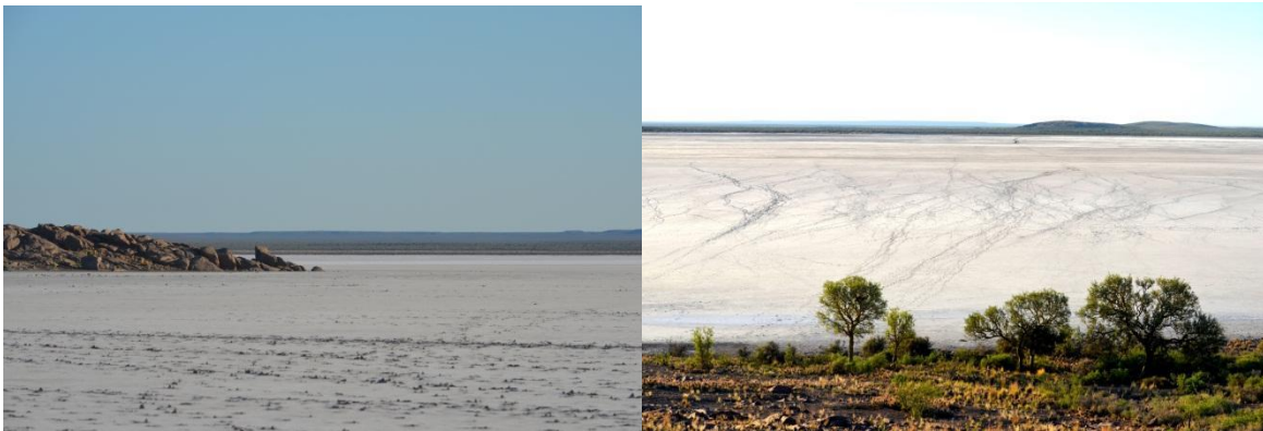
Figura 2.(izquierda) El Gran Salitral y el “cerro solo” ubicado en su interior y Figura 3 (derecha). El Gran Salitral visto desde el Cerro Solo. Fotografía: Beatriz Dillon, 21/03/2019.

Ubicado en los departamentos Puelén y Limay Mahuida se trata de un pfannen , de origen eólico formado en una depresión del paisaje circundante. Con sus 28km en sentido latitudinal y 22km en sentido longitudinal es la extensión lagunar más grande de la provincia de La Pampa. Está rodeado de bardas (barrancas) que alcanzan los 450msnm. En su interior presenta pequeñas islas rocosas de singular encanto.