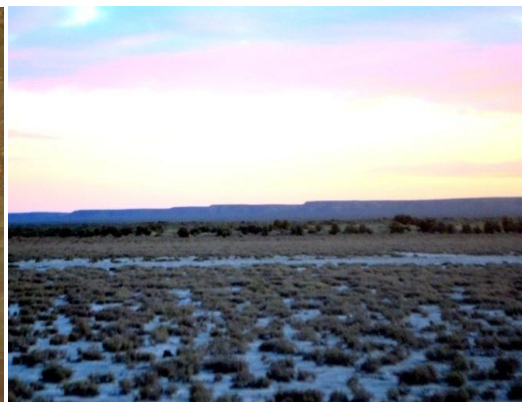
Figura 4. (izquierda). Gran Salitral, Salitral de la Perra y Meseta del Fresco, La Pampa