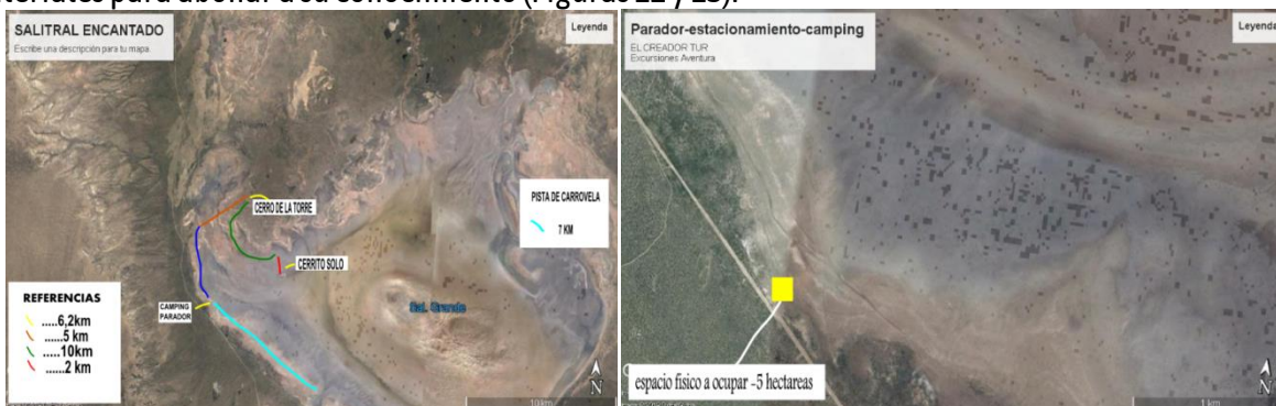
Figuras 10 y 11. Localización de los senderos y del espacio de servicios en el Gran Salitral

Simultáneamente y a la vez que analizan sus áreas de vacancia con respecto a los conocimientos van sumando capacitaciones organizadas en conjunto con los organismos provinciales y especialistas de la UNLPam (biólogos, geólogos, antropólogos, geógrafos, especialistas en turismo entre otros). Todas incluyen la visita al salitral con guías a modo de prueba, trabajándose sobre las dudas y necesidad de materiales para abonar a su conocimiento (Figuras 12 y 13).